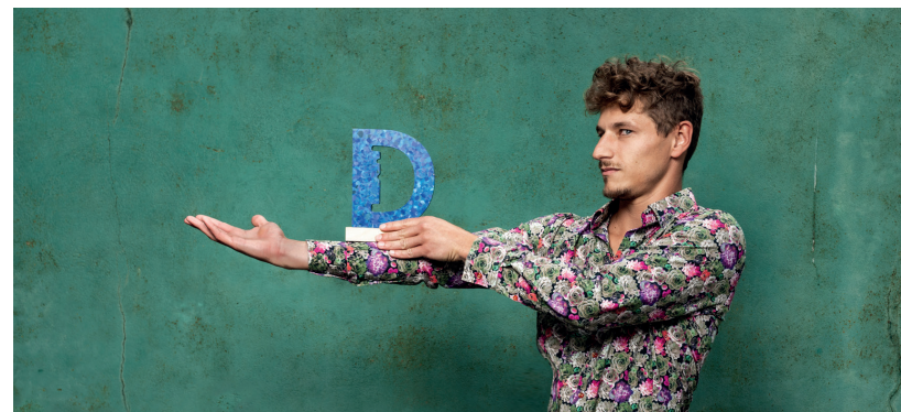
Designer: Maxence FORTIER - Studio L'INGRÉDIENT

Quelle proximité de travailler avec eux ! Contact Valesens