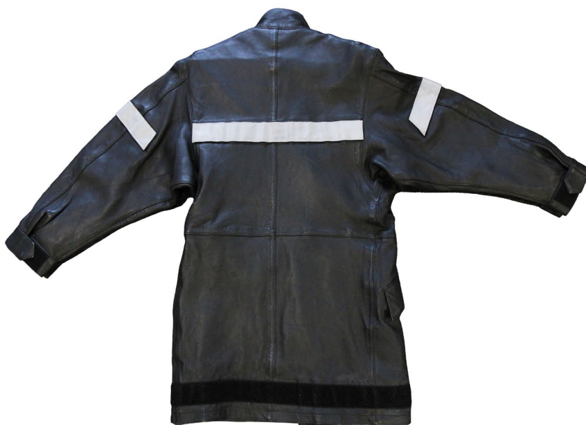
Vue arrière veste en cuir