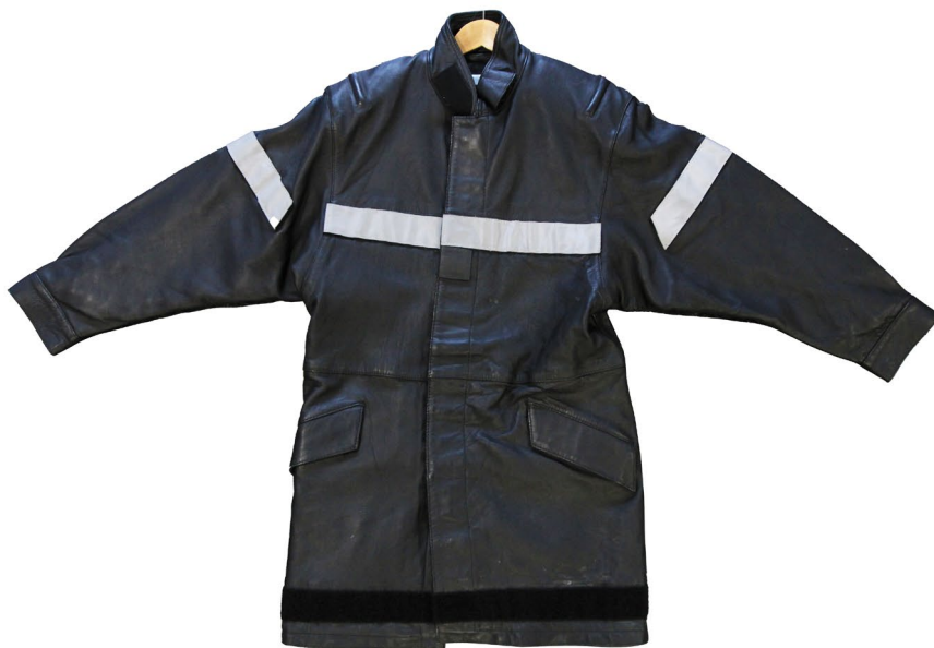
Vue avant veste en cuir